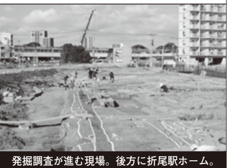
発掘調査が進む現場。後方に折尾駅ホーム。

調査は2月末で一旦終了し、4月から再開の予定。調査結果は北九州市芸術文化振興財団埋蔵文化財調査室のホームページで公開される。興味のある方はご覧いただきたい。