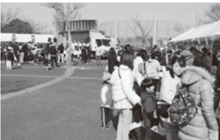
寒さ厳しい季節であったが、地域の笑顔が咲いた一日となった。