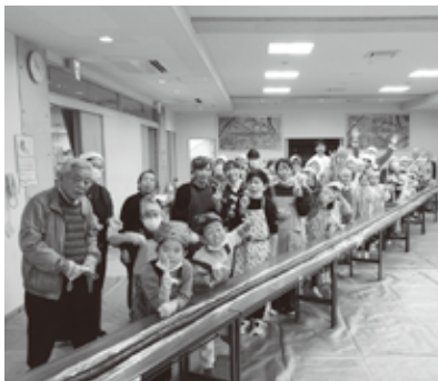
巻き寿司の完成を喜ぶ参加者(陣原市民センター)