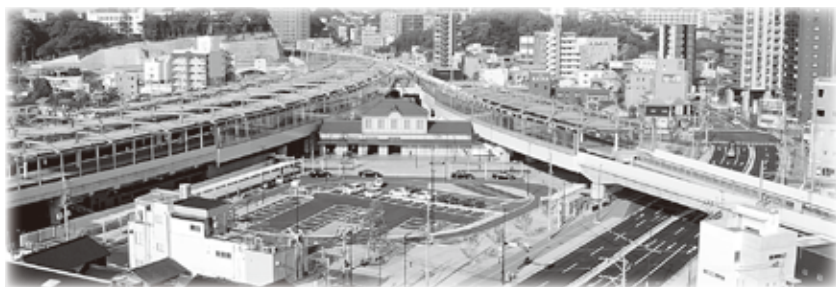
折尾駅北側駅前広場 令和5年4月完成