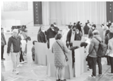
段ボール製の間仕切を組み立てる参加者たち