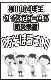
講師の質問に手を挙げて答える子どもたち