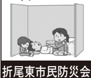
折尾東市民防災会