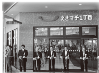
えきマチ1丁目折尾 令和5年9月開業