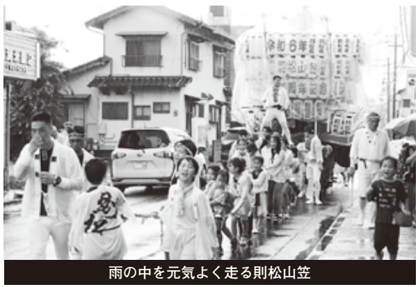
雨の中を元気よく走る則松山笠

雨で出発が危ぶまれたが、シートを施した提灯山笠が雨に濡れながらも予定どおり出発。太鼓と鉦の音頭に励まされながら、子どもたちが「オイサ、オイサ」の掛け声で元気よく山を曳き、町内を練り歩