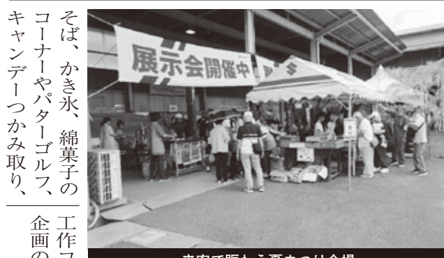
来客で賑わう夏まつり会場

サイコロゲームなど親子で遊べるコーナーのほか、野菜や花の販売コーナーが並び、特設ステージでは、男・女シンガーの歌やペリーダンス、ハーモニカ演奏などが繰り広げられた。無料手洗い、洗濯コーナーやお楽しみ工作コーナーなど多彩な企画の感謝祭となった。