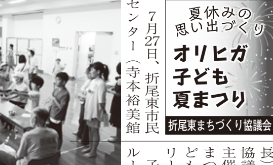
楽しむ子どもたち

後、境内で子どもたちが演じる「浦安舞」の奉納や「茅の輪くぐり」の神事があり、参拝者は扇と鈴の舞いを見学し、茅の輪をくぐりながら無病息災を祈った。午後からは境内で恒例の「ひのみねマルシェ」があり、キッズコーナーや地元竹藩カレー、実行委員会のテントが並び親子連れなど多くの参拝者で賑わった。