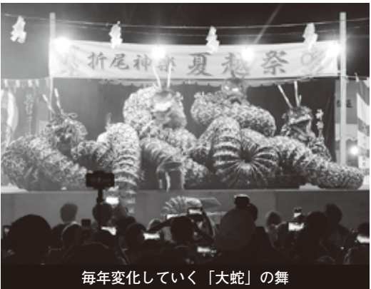
毎年変化していく「大蛇」の舞

7月27日、第46回折尾神楽夏越祭(折尾神楽保存会、折尾平成会主催)が開催され、会場の折尾西公園には神楽のお囃子が響き、多くの観客で賑わった。 会場には、日暮れ前から親子連れや浴衣姿の観客が続々と訪れ、神楽の