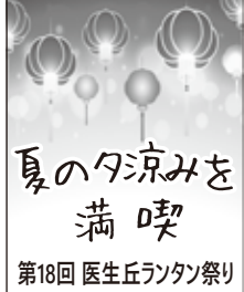
夏の夕涼みを満喫 第18回 医生丘ランタン祭り

7月27日、医生丘市民センター横イベント広場で第18回医生丘ランタン祭り(祭り実行委員会主催、医生丘まちづくり協議会・社会福祉協議会・大浦婦人会・株総合システム共催のランタン祭り)があり、浴衣姿の子どもたちや親子連れなどで賑わった。