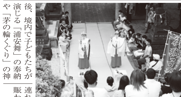
境内石段の特設席でおごそかな「浦安舞」を見守る観客

後、境内で子どもたちが演じる「浦安舞」の奉納や「茅の輪くぐり」の神事があり、参拝者は扇と鈴の舞いを見学し、茅の輪をくぐりながら無病息災を祈った。午後からは境内で恒例の「ひのみねマルシェ」があり、キッズコーナーや地元竹藩カレー、実行委員会のテントが並び親子連れなど多くの参拝者で賑わった。