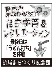
夏休みまなびの教室 自主学習 & レクリエーション 最終日は「うどん打ち」を体験 折尾まちづくり記念館

7月22日から8月6日までの12日間、折尾まちづくり記念館(片山恭子館長)で夏休みまなびの教室が開催され、多くの子どもたちが自主学習とレクリエーションに参加した。朝9時半に集合した子どもたちは、始まりの会やラジオ体操の後、自主学習を開始。分からない問題や難しい問題など