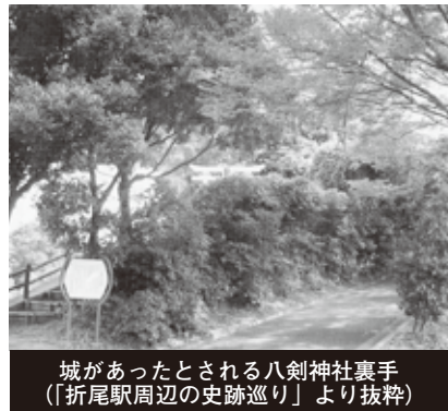
城があったとされる八剣神社裏手(「折尾駅周辺の史跡巡り」より抜粋)

人たちに、範頼への協力を強く下知している。 その下知によって、「白杵惟隆、緒方惟栄ら、参州の命を含み、八十二艘の兵船を献す。また周防国の住人宇佐那木遠降兵糧米を献す。これによって参州トモを解き、豊後国に渡る。同時に進み渡る輩(人名省略)」。このとき、全部が九州に渡ったのでなく、一部は周防にとどまっているようである。 ▼一月二十六日 参州豊後国に渡る。北条小四郎