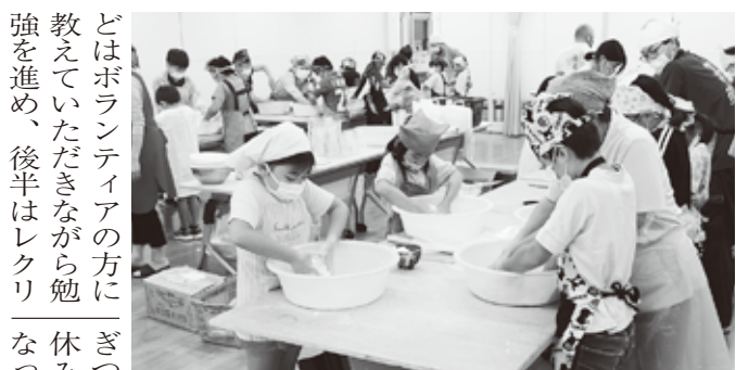
ボウルでうどんをこねる子どもたち

どはボランティアの方に教えていただきながら勉強を進め、後半はレクリエーションを楽しんだ。夏休みは、多目的ルームで射的やパッパコ、輪投げのゲームを楽しんだ後、ボランティアルームでラックキーパンチボックスのお菓子を